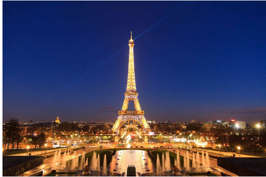
La tour Eiffel

Paris , surnommée la Ville Lumière , est une commune française, capitale de la France. Cette ville est construite sur une boucle de la Seine . Ses habitants sont appelés les Parisiens. Elle est connue dans le monde entier pour sa vie artistique et culturelle et est d'ailleurs la ville la plus visitée au monde. Paris est aussi un centre politique et économique majeur. Le maire de la commune actuellement est Anne Hidalgo. C'est la plus grande ville de France . Paris est également la commune la plus peuplée. La population de la ville de Paris est de 2 211 297 habitants en 2008 1 , mais 11,8 millions habitent dans son agglomération et ses alentours .