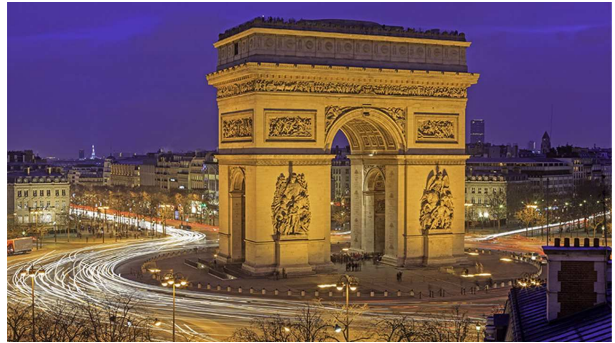
L'Arc de Triomphe