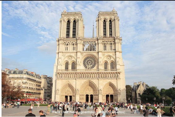
La cathédrale Notre-Dame