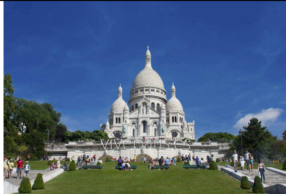
La basilique de Montmartre